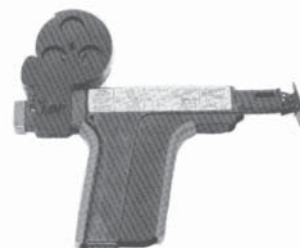
70105660 AMP Maxi Termi-point käsityökalu

Termi-Point -liitosjärjestelmään kuuluvat aina myös työkalut.